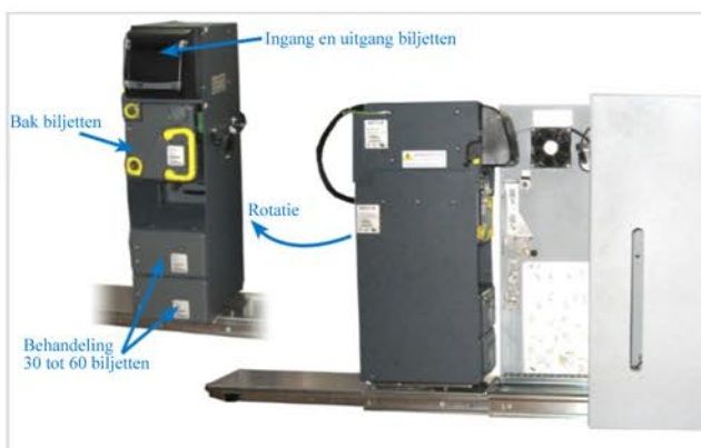
Biljet module - Opening achterkant

De stevige kwaliteit van de INT-C2R brengt rust en sereniteit. Dit incasso systeem is uitgedacht volgens en voor proxi handel criterias.